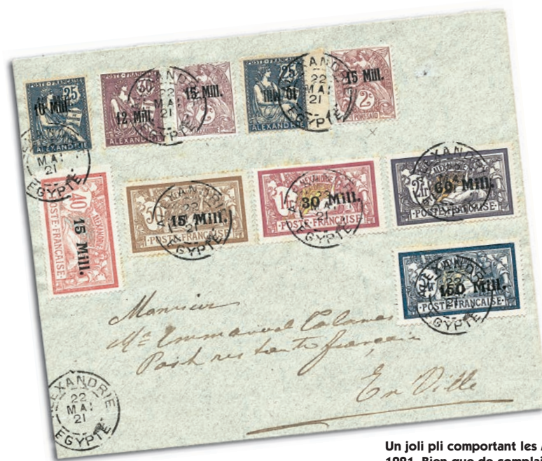
Un joli pli comportant les Merson de la série de 1921. Bien que de complaisance, ce type de pli d'Alexandrie n'est pas facile à se procurer.

Pas facile de réunir tous les Merson ayant servi à l'étranger, mais quelle collection passionnante ! Non seulement les timbres sont beaux mais en plus ils vous apprendront tant de choses sur les régions du monde où ils sévirent. Comme pour leurs cousins de France, n'hésitez pas à vous procurer des exemplaires de « second choix » si vos finances vous le demandent. Ce mois-ci partons pour l'Afrique.